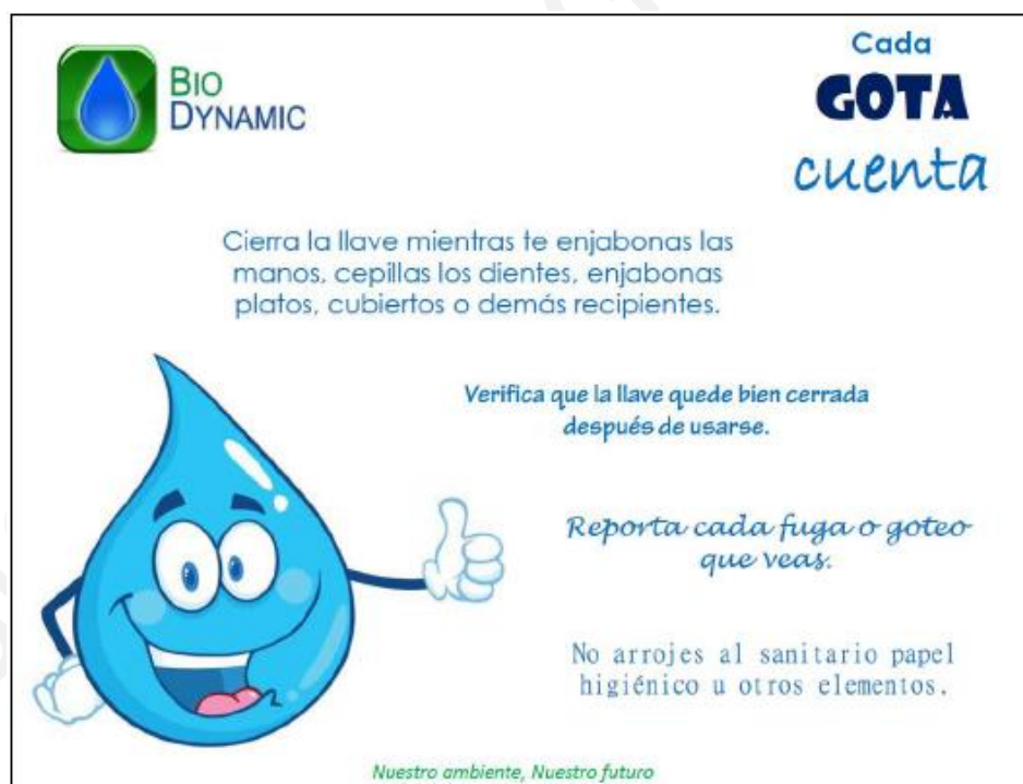
ILUSTRACIÓN 6. CARTEL DE CONCIENCIACIÓN PARA EL USO EFICIENTE DEL AGUA.

Carrera 74b # 54-37, Barrio Normandía – Cel.: 3107839235 e-mail: contacto@biodynamicgroup.com www.biodynamicgroup.com Bogotá, Colombia