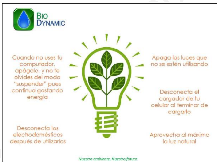
ILUSTRACIÓN 5. CARTEL DE CONCIENCIACIÓN PARA EL USO RACIONAL DE LA ENERGÍA.

Es debido mencionar que, durante las actividades diarias de la empresa, no se tienen procesos productivos que involucren el uso de grandes cantidades de energía en equipos o maquinarias, por el contrario, el consumo de energía eléctrica esta mayormente relacionado con las actividades administrativas de la organización.