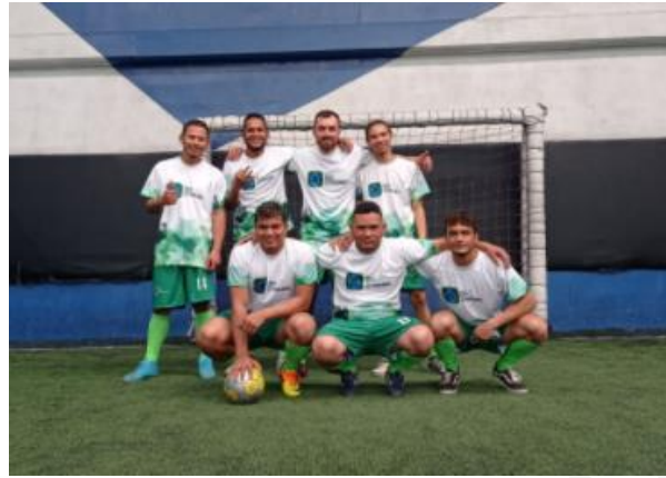
ILUSTRACIÓN 3. INTEGRACIÓN FIN DE AÑO EQUIPO DE BOGOTÁ.